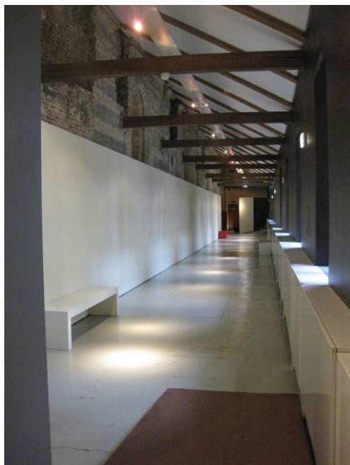
← De (nu nog) lege kamer vol herinneringen...